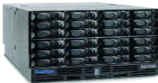
QUANTUM DXi5500 APPLIANCE

"Ma le novità non si fermano qui - conclude Gasparello - restate sintonizzati con noi per conoscere l'evoluzione della nostra strategia commerciale che si annuncia intensa per la fine del 2007."